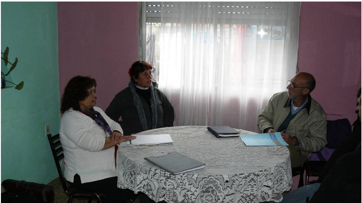
Vista del barrio y de la tipología de las viviendas.