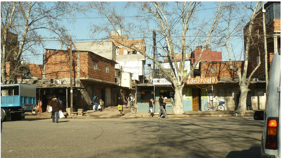
Vistas generales del barrio y de la tipología de viviendas.