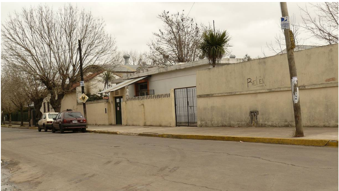
Vistas generales del Barrio Carola Lorenzini y sus servicios.