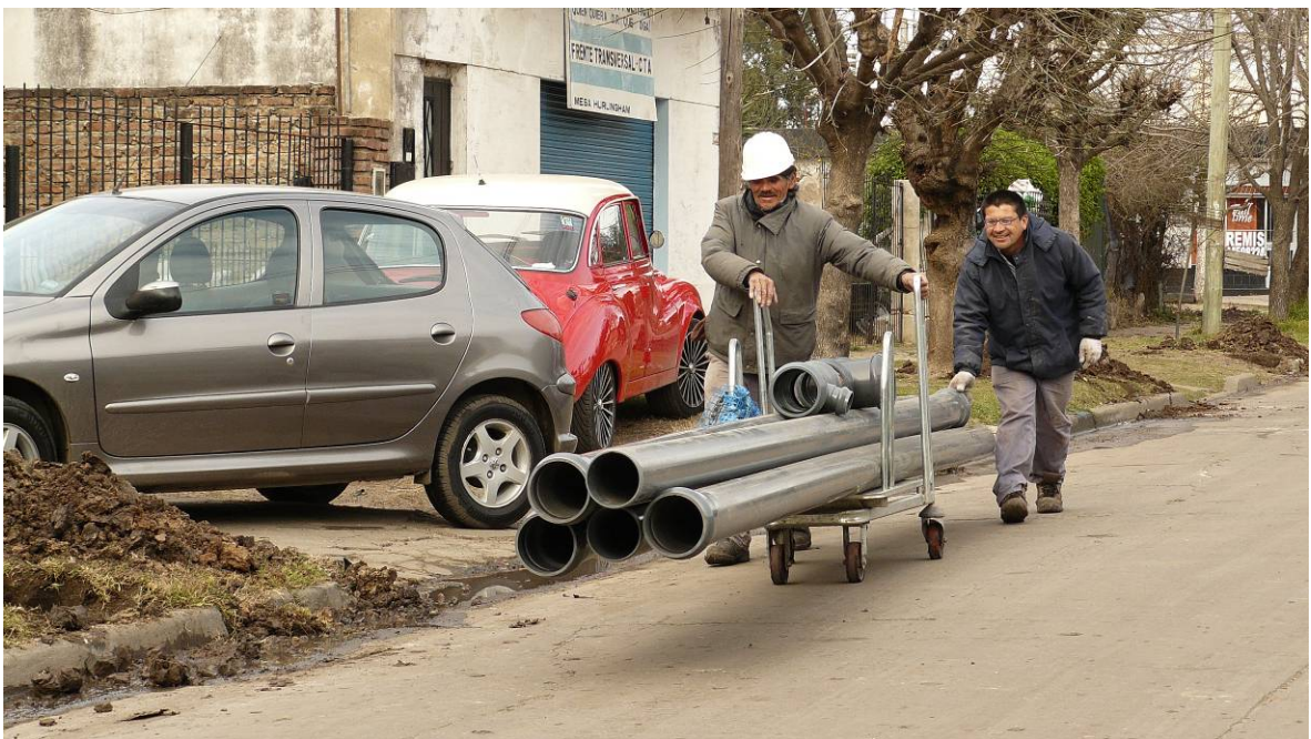
Imágenes de la construcción del tendido de red de agua potable Plan Agua+Trabajo