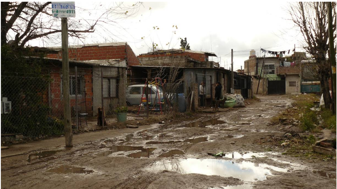
Vista de las calles del barrio y de la tipología de viviendas.