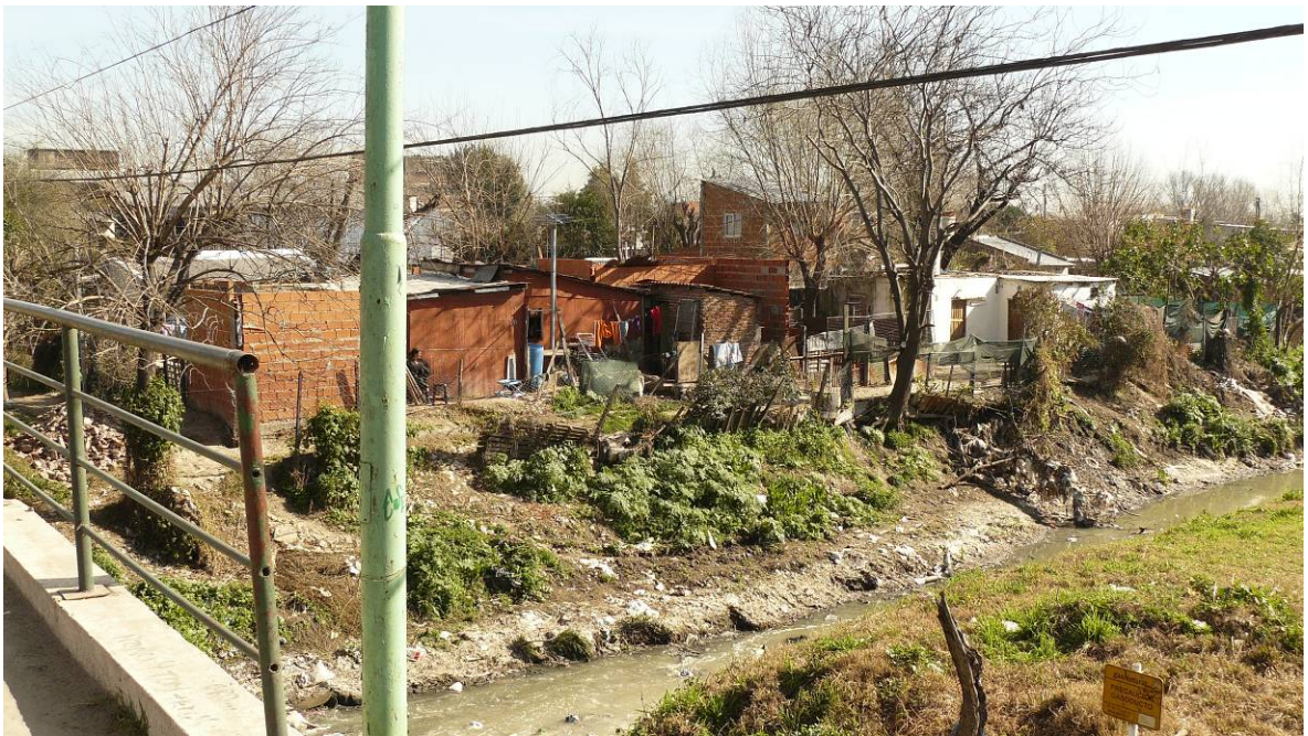
Vistas de las viviendas ubicadas junto al arroyo.