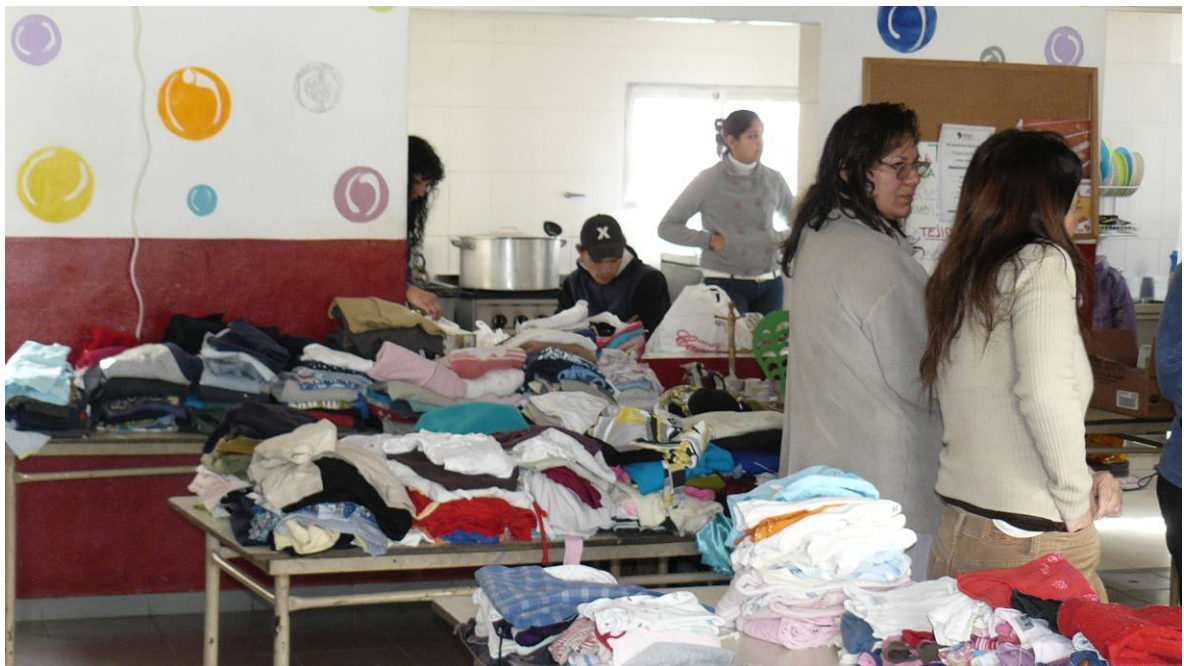
Vista de la colecta de ropa realizada por el Comedor.