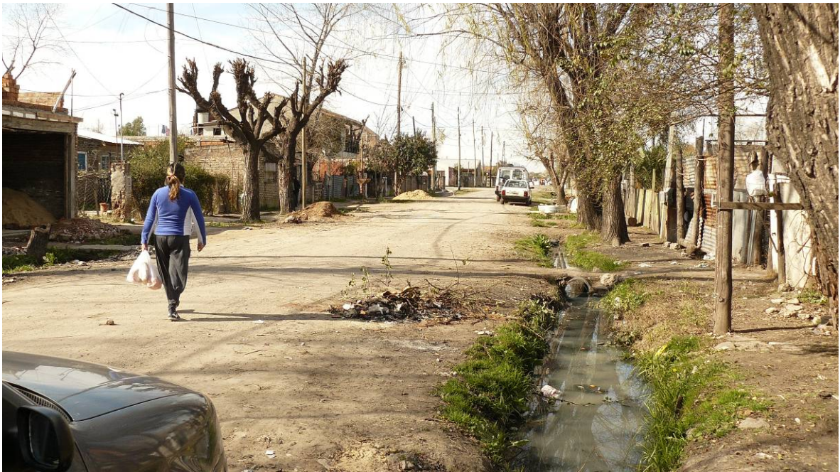
Vistas generales del barrio: zanjas con agua contaminada y basura en las calles.