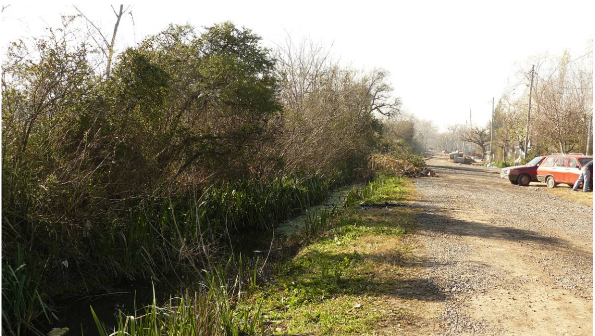
Vista de las zanjas donde se vierten aguas servidas de los hogares.