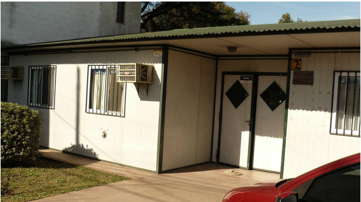
Vista del Centro de Prevención y Asistencia en Nutrición “Cecilia de Albino”