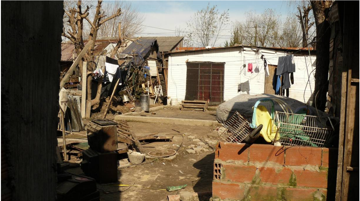
Vista de la tipología de las viviendas.