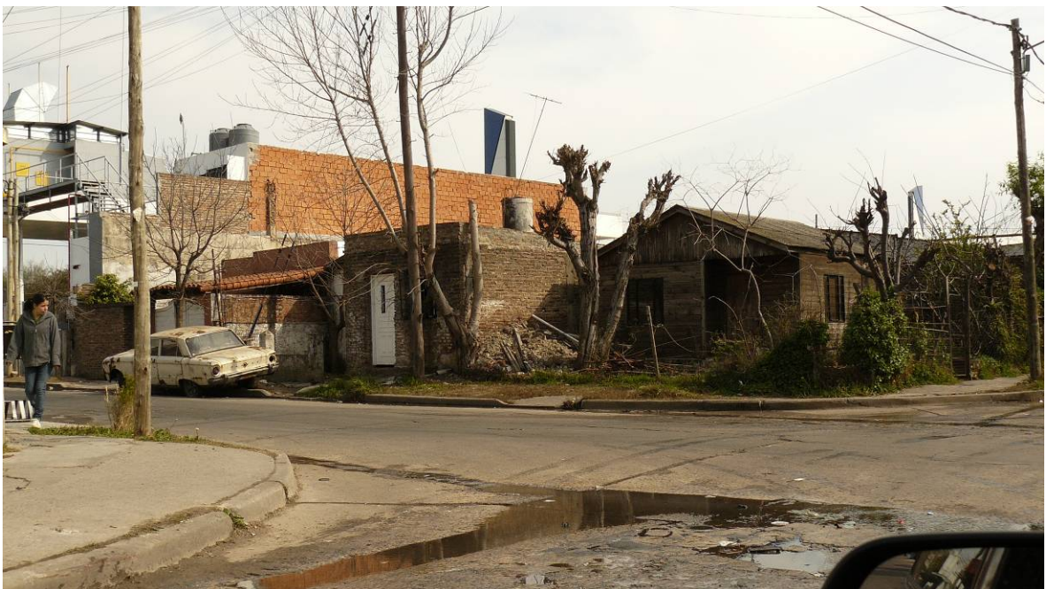
Vista general del barrio y de la tipología de las viviendas.