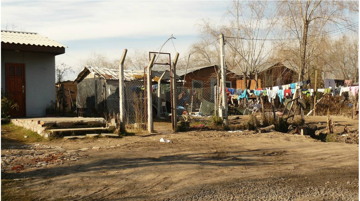
Vista de la tipología de las viviendas.