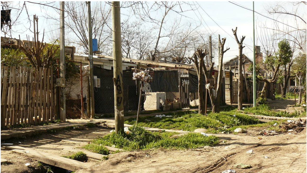
Vistas generales del Barrio Las Tunas y de las diferentes tipologías de las viviendas.