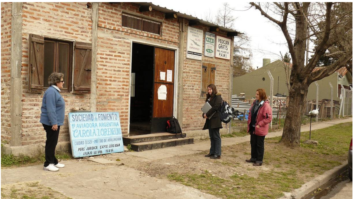
Vista de la Sociedad de Fomento "1º Aviadora Argentina"