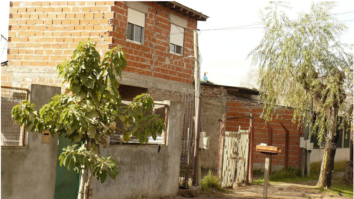
Vista de la tipología de las viviendas.