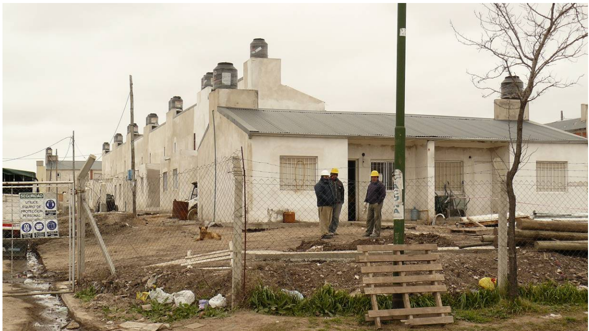
Imágenes de las viviendas en construcción por medio del Plan Federal de Viviendas.