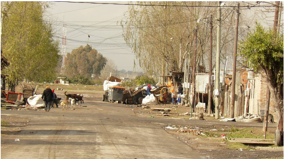
Vista de las condiciones de las calles y de a basura acumulada en espacios públicos.