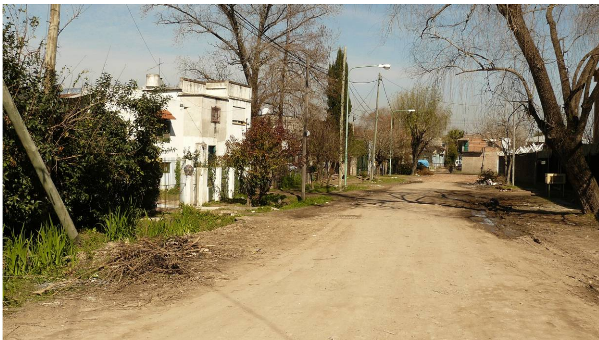
Vista del Barrio Tucán.